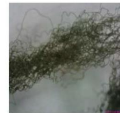
高弹高缩加工纤维